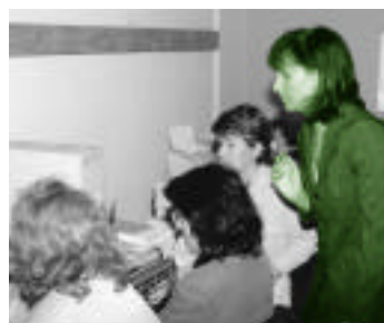
Επιμόρφωση καθηγητών Ξένων γλωσσών - Οδυσσεάς

Η έννοια της επιμόρφωσης των εκπαιδευτικών της Οδύσσειας στην παιδαγωγική αξιοποίηση των Νέων Τεχνολογιών, δεν σημαίνει απλή εξοικείωση των επιμορφούμενων με τον Η/Υ. Σκοπός της επιμόρφωσης είναι να ενσωματωθούν με ομαλό τρόπο οι Νέες Τεχνολογίες στην καθημερινή διδακτική πράξη ανεξαρτήτου μαθήματος διδασκαλίας. Όλες οι ειδικότητες καθηγητών δικαιούνται επιμόρφωσης, αφού όλα τα μαθήματα μπορούν να εμπλουτίζονται και να ανανεώνονται με εξελιγμένους τρόπους μετάδοσης και εμπέδωσης.